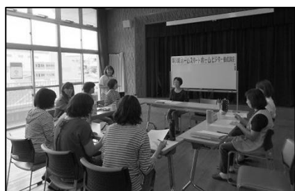
2017年度第5回ビジター養成講座

※新型コロナウイルス等の感染予防のため、マスクの着用・検温・手指の消毒・体調のお尋ね等へのご理解ご協力をお願い致します。